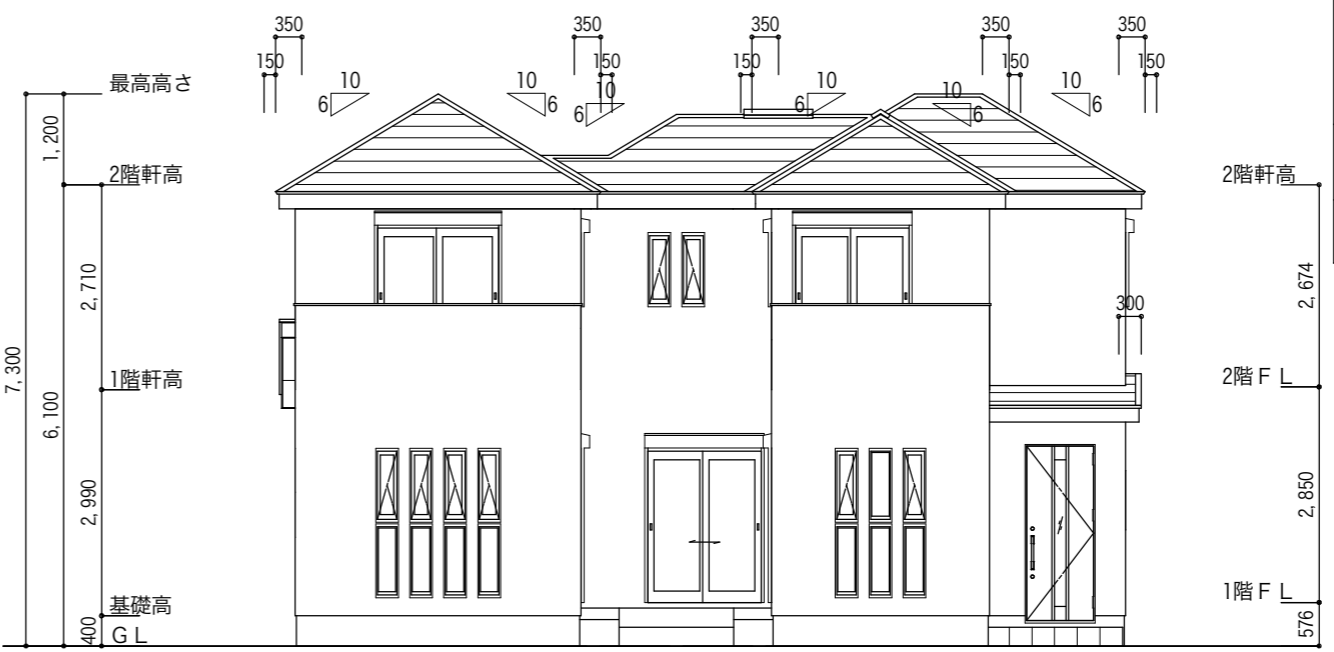
西側 立面図 S:1/100