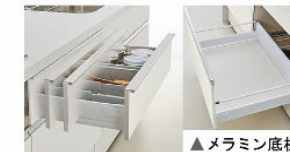
ソフトモーションレール