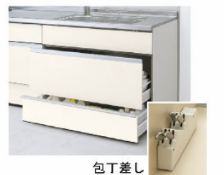
包丁差し スライドストッカー (ポケットなし)