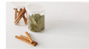
人造大理石トップ

インテリアに合わせてカラー コーディネート。耐久性にも 優れた人造大理石トップです。