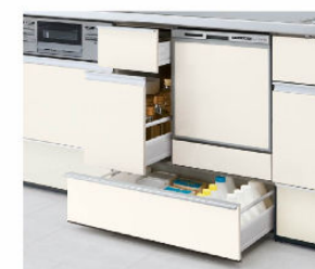
スライドストッカー 3段引出し 浅型用