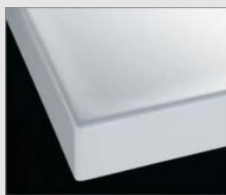
H プレーンホワイト