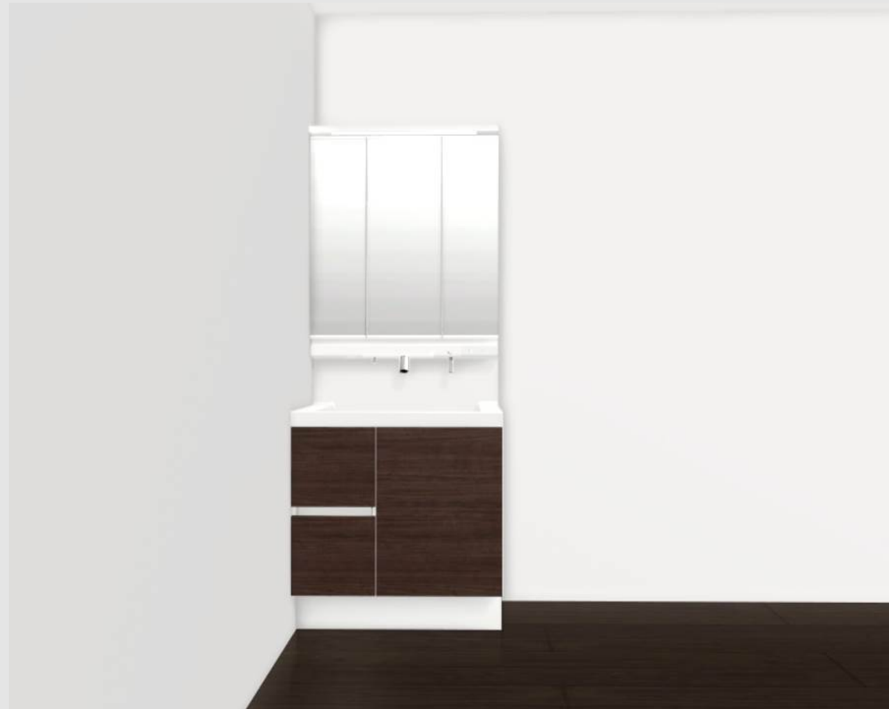
CG合成によるイメージ画像です。