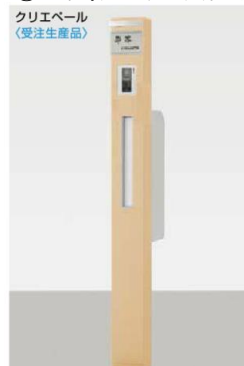
錆物サイン ネームシールドタイプにした場合

柱セット インターホン用(PA) インターホンカバー(PW) スリム縦型ポスト錠なし(PW) 錆物サイン(PW)パターン集選択タイプ スリムサインライト(PW) トランス電源ユニット