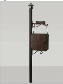
サイン ネームシールドタイプ

ポール(BK) エクスポストハンクス(GT) ポスト取付金座(上)横込みフラットサイン用(DK) ポスト取付金座(下)ハンクス用(DK) 横込みフラットサイン(パターン集選択タイプ)(PK) LED照明ユニット(BK)