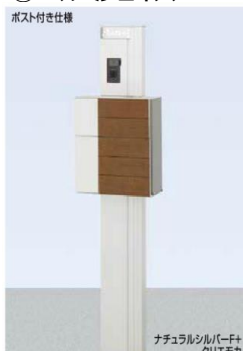
クリスタルガラスサイン ネームシールドタイプ

柱セット クリスタル照明-インターホン用(PW) インターホンカバー ポスト グレイス ウッド(PW+RA) クリスタルガラスサイン(パターン集選択タイプ) DC12V内蔵トランス電源