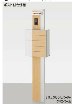
横長ガラスサイン ネームシールドタイプ

柱セット インターホン用(PW+PA) インターホンカバー ポスト グレイス ウッド(PW+PA) 横長ガラスサイン(一段文字タイプ) 庇(ひさし)照明(PW) DC12V内蔵トランス電源