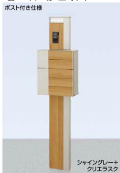
クリスタルガラスサイン ネームシールドタイプ

柱セット クリスタル照明-インターホン用(SC+QA) インターホンカバー ポスト グレイス ウッド(SC+QA) クリスタルガラスサイン(パターン集選択タイプ) DC12V内蔵トランス電源