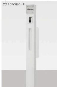
ガラスサイン ネームシールドタイプにした場合

柱セット サイン照明付き-インターホン用(PW) インターホンカバー(PW) スリム縦型ポスト錠なし(PW) ガラスサイン(クリア)パターン集選択タイプ トランス電源ユニット