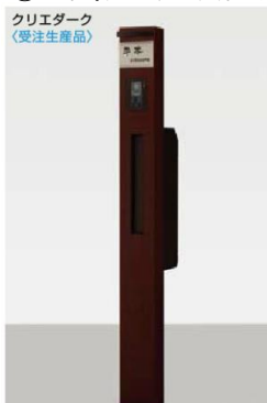
錆物サイン ネームシールドタイプにした場合

柱セット インターホン用(SA) インターホンカバー(MB) スリム縦型ポスト錠なし(MB) 錆物サイン(SC)パターン集選択タイプ スリムサインライト(MB) トランス電源ユニット