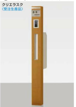
錆物サイン ネームシールドタイプにした場合

柱セット インターホン用(QA) インターホンカバー(PW) スリム縦型ポスト錠なし(PW) 錆物サイン(PW)パターン集選択タイプ スリムサインライト(PW) トランス電源ユニット