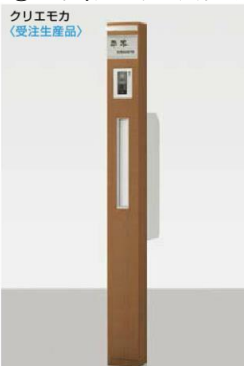
錆物サイン ネームシールドタイプにした場合

柱セット インターホン用(RA) インターホンカバー(SC) スリム縦型ポスト錠なし(SC) 錆物サイン(SC)パターン集選択タイプ スリムサインライト(SC) トランス電源ユニット