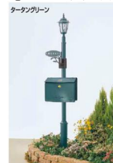
タータングリーン