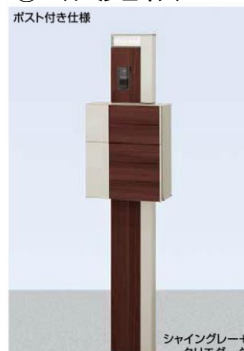
クリスタルガラスサイン ネームシールドタイプ

柱セット クリスタル照明-インターホン用(SC+SA) インターホンカバー ポスト グレイス ウッド(SC+SA) クリスタルガラスサイン(パターン集選択タイプ) DC12V内蔵トランス電源