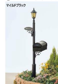
マイルドブラック