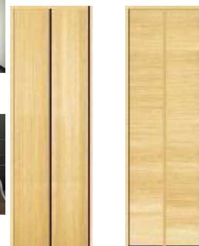
開き戸：縦木目 レスフラットデザイン 開き戸：横木目 レスフラットデザイン