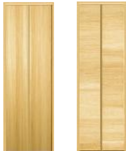
折れ戸：縦木目 レスフラットデザイン 折れ戸：横木目 レスフラットデザイン