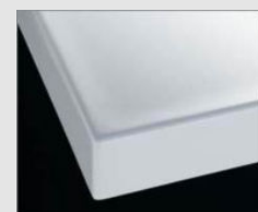
H ブレンネホワイト