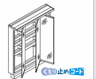
3面鏡(全収納・スリムLED) MVJ1-753TXJU